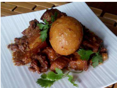
Porc caramel traditionnel