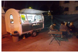
Soirée Cabaret Aléatoire