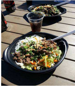
Bo Bun au soleil !