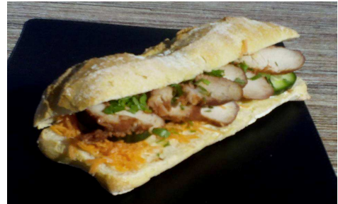
Sandwich vietnamien Banh A