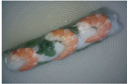
Rouleaux de printemps poulet crevettes